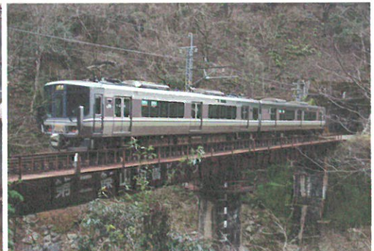
第二篠山川橋りょうを渡る福知山線の電車