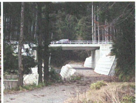
川代トンネルを裏側から見ることもできる