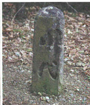
大正10年(100年前)の石碑