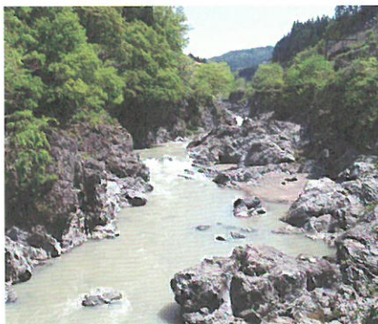
迫力ある岩肌を見せる「川代渓谷」