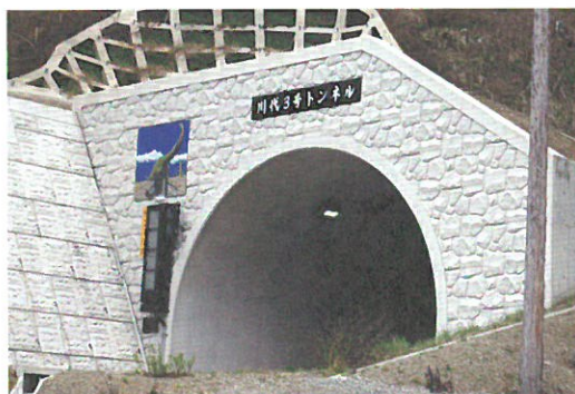
川代3号トンネルには「丹波竜」が描かれる