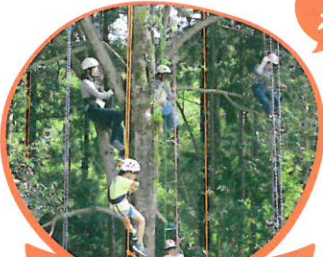
ツリーイング体験 ロープを使った木登り体験