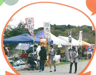
丹波エリアうまいもん市 丹波エリアのうまいもんが大集合!