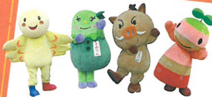
はばたん まめりん まるいの ちーたん (兵庫県) (丹波篠山市) (丹波篠山市) (丹波市)