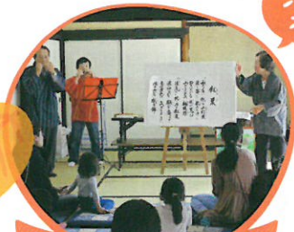
丹波のむかしばなし 語り部サークルによるむかしばなし