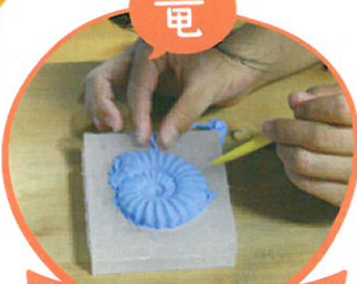
アンモナイトレプリカづくり 化石発掘体験もありますよ!