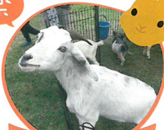
ふれあい動物園 動物のえさやり体験も!