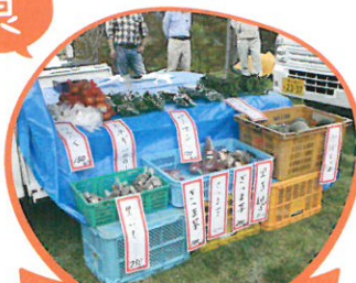
軽トラ市 丹波の旬の農作物の販売